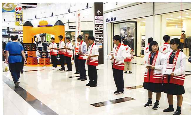
イオンモール福津での街頭募金