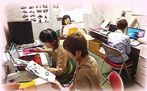
広報誌の音訳活動