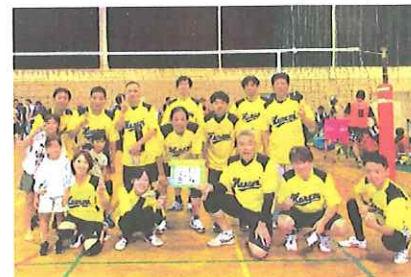
花見3区・4区合同チーム

9月10日、全市バレーボール大会に参戦 福間小学校体育館や福津市体育館で開催され、1区・2区合同チームおよび3区・4区合同チームが参戦しました。残暑の中、熱戦が繰り広げられました。