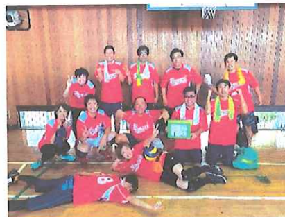
花見1区・2区合同チーム