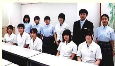
上の写真は 大好評だったスマホ教室

この委員会の活動を通じて、地域の方々と交流を深めたり、共に喜びを分かち合える機会を考えていきたいです。