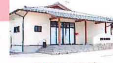
南町公民館 西福間3丁目 39-1 ☎42・4500