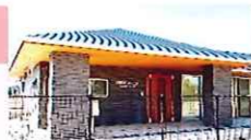
西福間5区公民館 西福間5丁目21