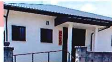
昭和公民館 中央6丁目5-5