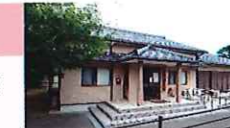
本町公民館 西福間2丁目 7-21 ☎42・3128