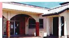
西福間1公民館 西福間1丁目 21-21