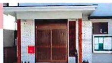
松原公民館 中央6丁目21-15