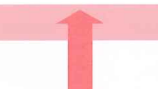
大和町公民館 中央3丁目9-13 ☎090・6773・9117(管理人)