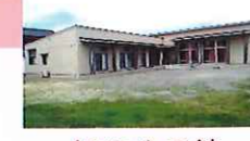
緑町公民館 西福間3丁目 15-3 ☎42・1305

【自治会長】 中野慎一 【エリア】 西福間2丁目、3丁目(一部)、西福間4丁目(全域)