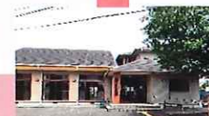
花見公民館 花見が丘2丁目 12-25 ☎42・3105