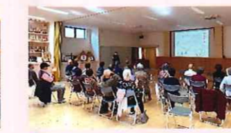
花見3・4区福祉会 歌声喫茶