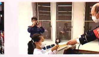
花見2区子ども会 子ども会防火夜回り表彰式