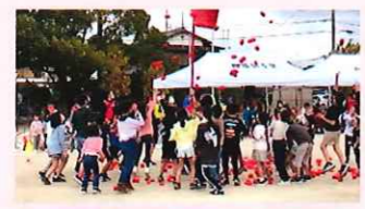
西福間5区 西福間5区運動会