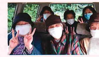
南町区 外出支援活動