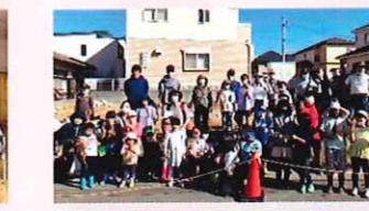
昭和区福祉会 子ども会と合同で芋ほり