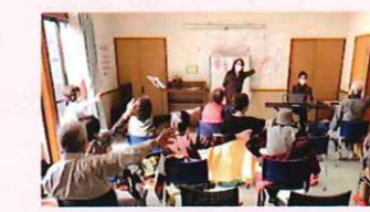
本町区福祉会 ほっとサロン「音楽療育活動」