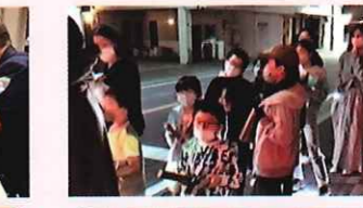
福間松原区子ども会 防火夜回り