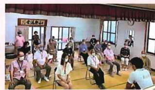
大和I区福祉会 なかよしサロン