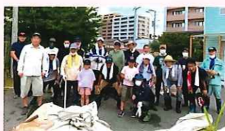
花見総区 井尻川の清掃活動