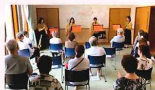
本町区福祉会 サクソ四重演奏会