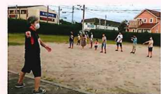
南町子ども会 夏休みのラジオ体操