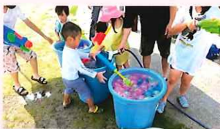
西福間5区 ミニプレーパーク(水遊び)

感染症対策を行いながら、郷づくりの会の各部会や自治会、福祉会、子ども会などが活動を再開しています。