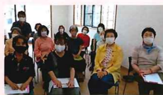
昭和区福祉会 サロン部会の シニア健康測定会