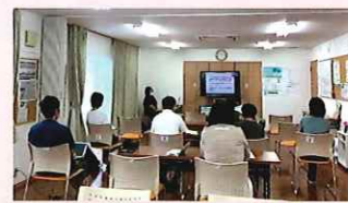
不登校から育ちを考える ひなぎくの会 サポートBOOK発行記念 オンライン講演会の視聴会