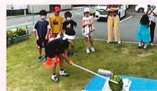
ふくまアンビシャス広場 夏休みアンビですいか割り