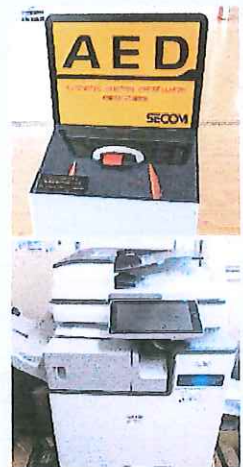
▲常設されたAEDと新しいコピー機