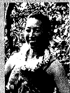
福岡市内や県外のイベントで活躍中の素敵な先生です。