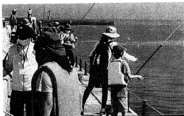
大島デイキャンプ