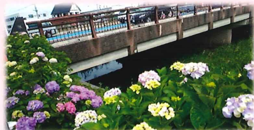
旭橋から越田橋の間、西郷川沿いの約400mが「あじさいロード」です。