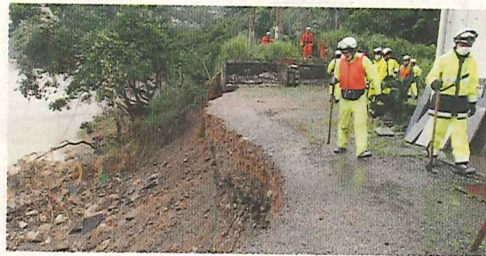
行方不明者捜索活動

令和2年7月豪雨において、大きな被害が発生した熊本県に対し、消防庁官から緊急消防援助隊出動の指示に基づき7月4日(土)から7月6日(月)及び7月8日(水)から7月10日(金)までの間、当本部から延べ車両5台、15人を福岡県大隊として派遣し、活動を行いました。