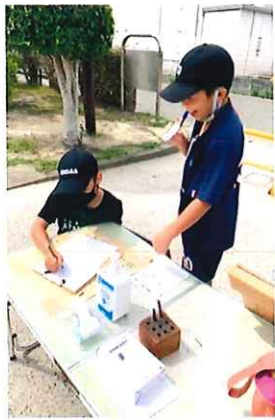
再開後の受付の様子